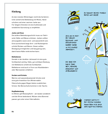
Beispiel Doppelseite Broschüre