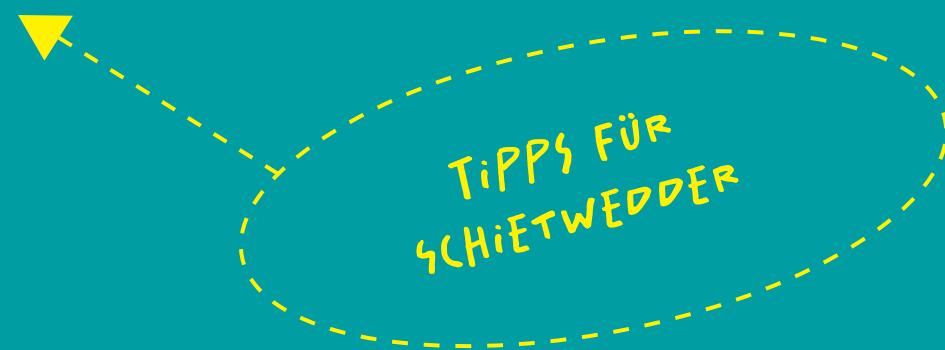
Broschüre, Format DIN Lang, 16 Seiten Abbildung: Titelseite